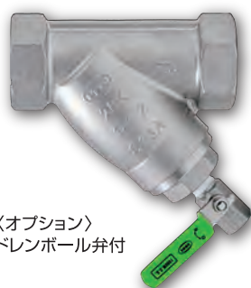
〈オプション〉 ドレンボール弁付